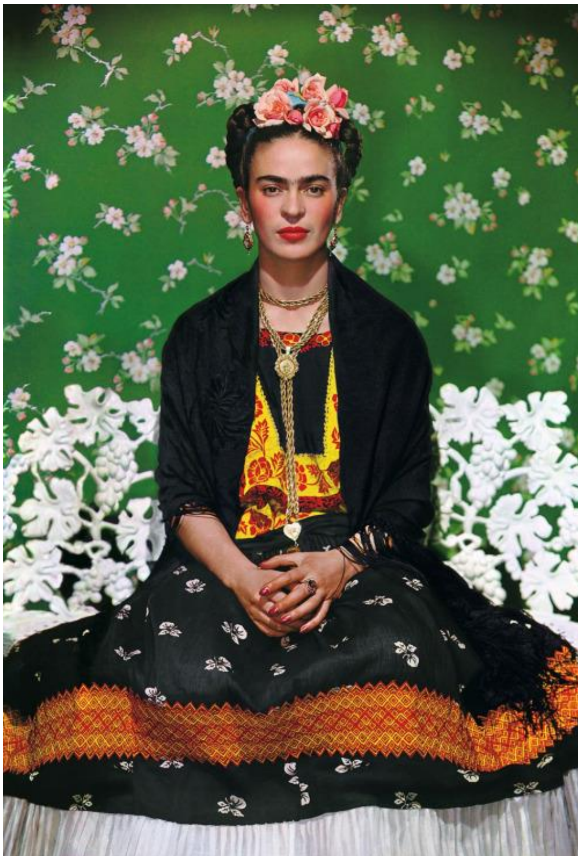
Figura 1 - Muray's, Frida Kahlo on white bench, 1939.