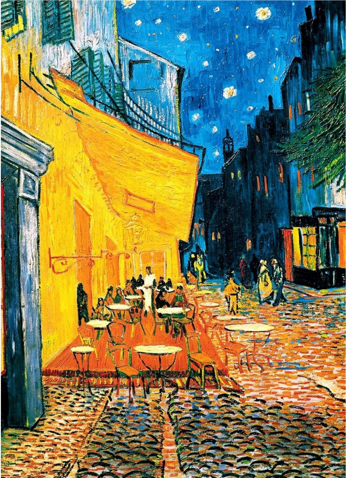
Figura 2 - Van Gogh, Café terrace at night, 1888.