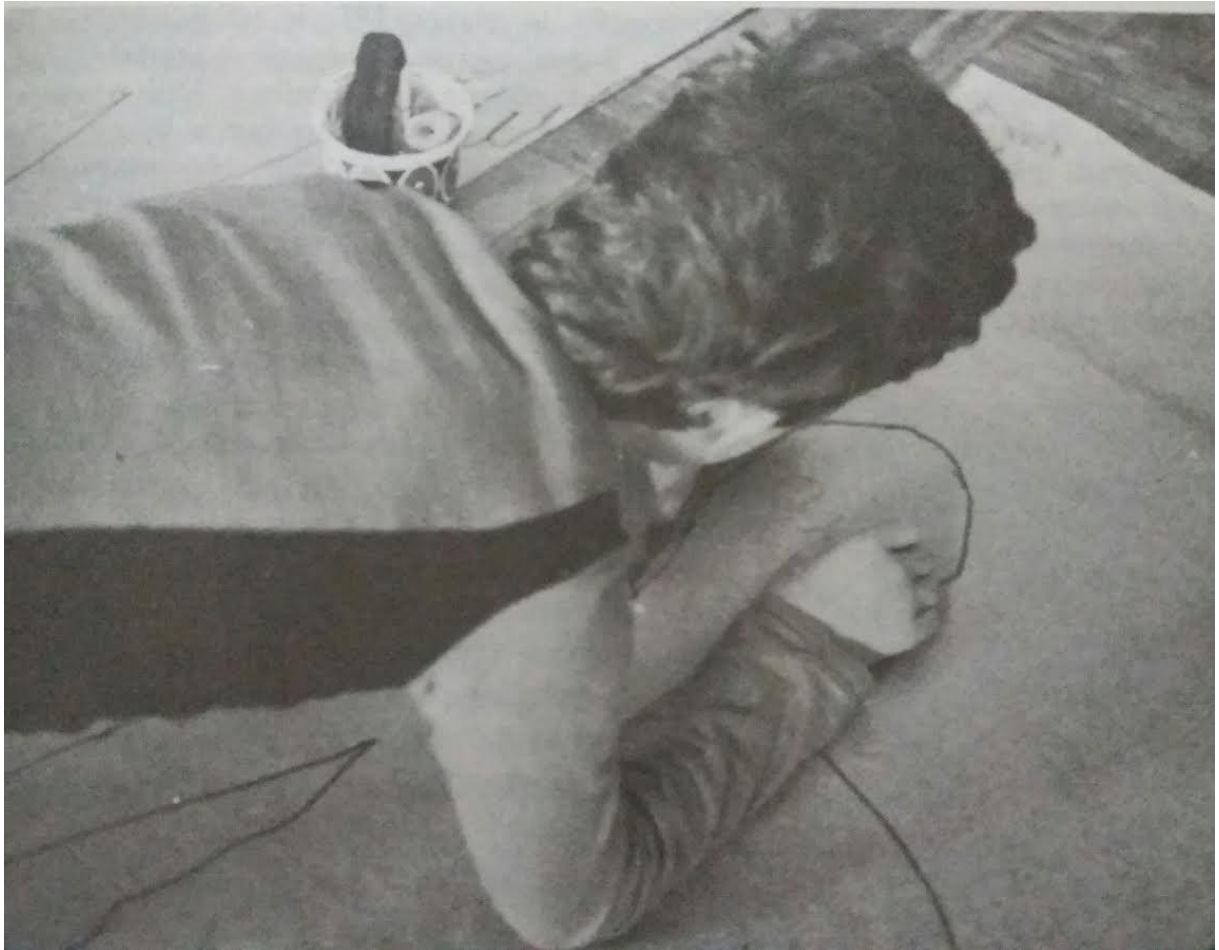
Figura 6 – Atividade com desenho, relatada por Reily.

Do mesmo modo, utiliza texturas, consistência física e térmica dos objetos, e conforme a criança vai avançando, ela utiliza novos materiais, inclusive a linha, revistas, histórias em quadrinhos, entre outros.