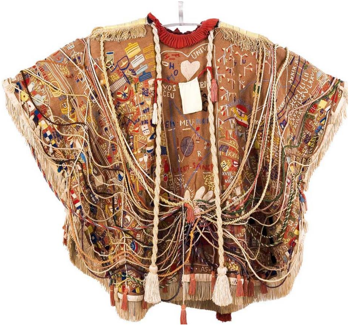
Figura 3 – Arthur Bispo do Rosário, Manto da Apresentação, 1989.