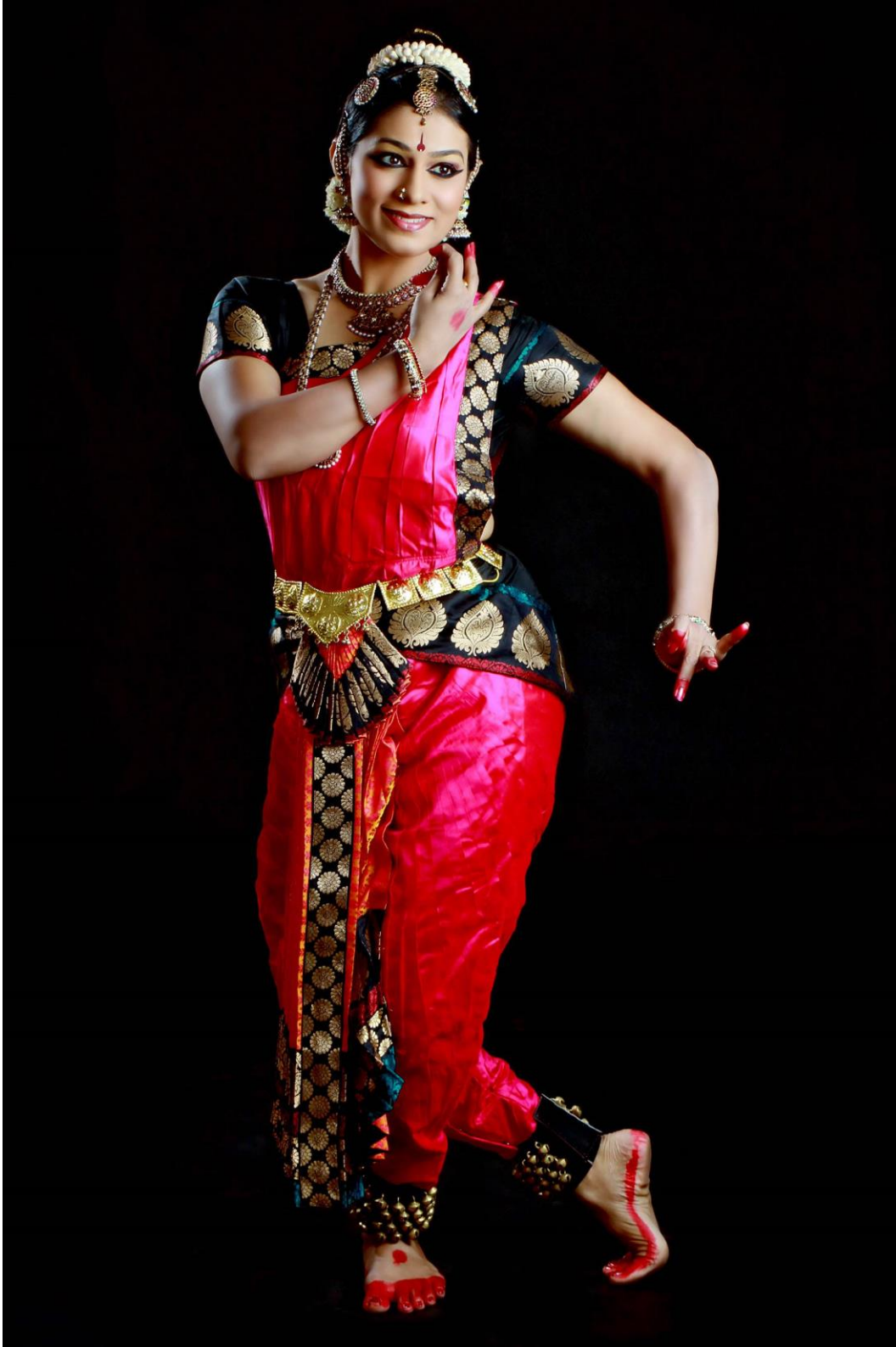
Figura 7 - Sudha Chandran, dançarina clássica indiana.