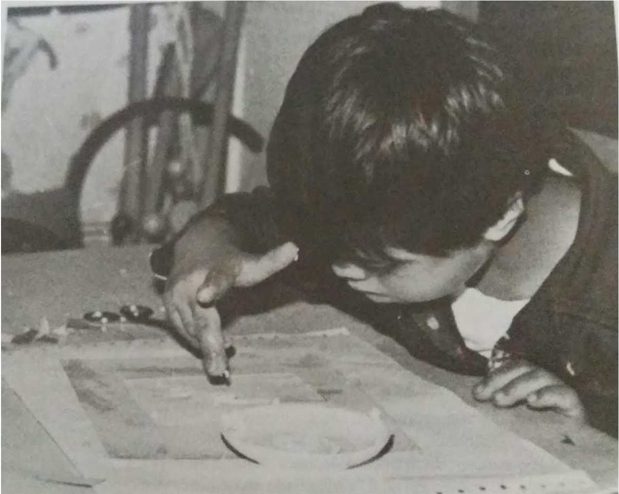
Figura 5 – Atividade com material diferenciado em aula de arte.

atividades, permite que os alunos repitam habilidades já adquiridas, combinando com tarefas diferentes, o que leva a segurança, combate a estereótipos e o estímulo à imaginação, de acordo com Reily (1993).