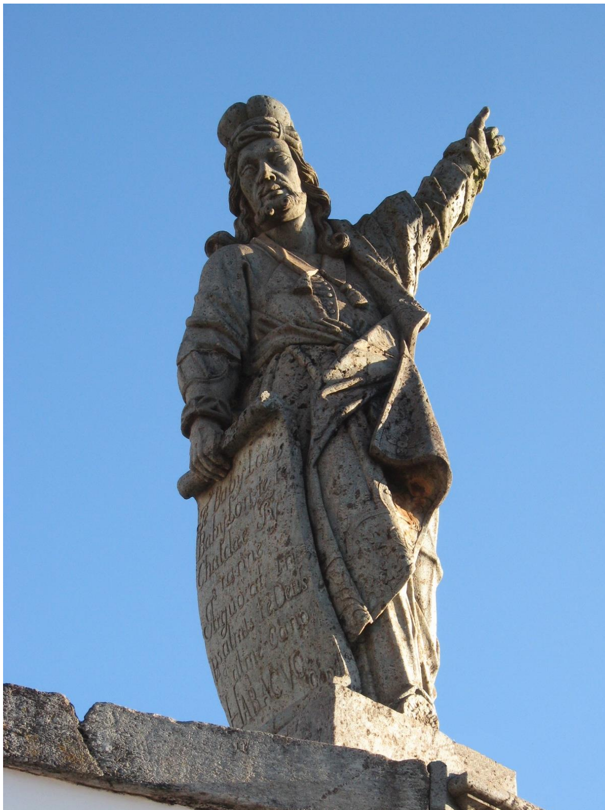
Figura 4 - Lisboa [Alejadinho], Profeta Habacuque