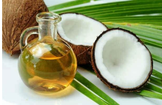
Figura 3: Ilustração cosmético natural