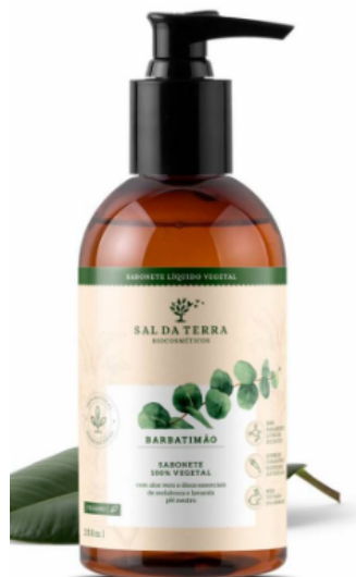
Figura 7: Sabonete líquido Barbatimão Sal da Terra