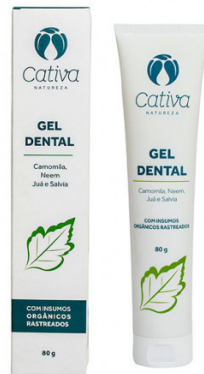
Figura 6: Gel dental Cativa Natureza