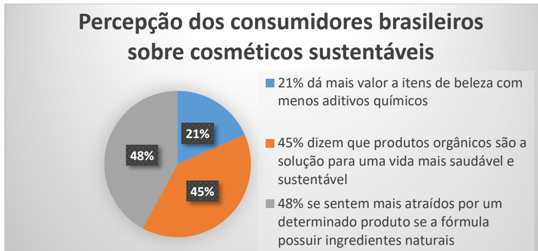
Gráfico 1: Percepção dos consumidores brasileiros sobre cosméticos sustentáveis

Ainda segundo Szalai (2018) o levantamento realizado com 1517 participantes gerou os seguintes dados (Gráfico 1):