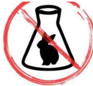
Figura 4: Ilustração não realização de testes em animais