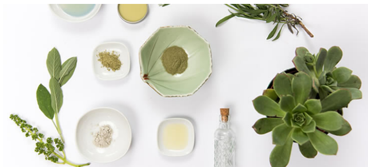
Figura 2: Ilustração cosmético orgânico