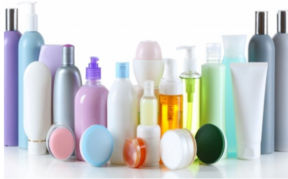
Figura 1: Ilustração cosméticos convencionais