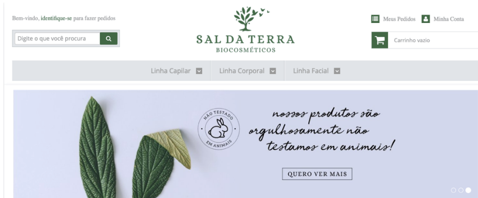
Figura 8: Página da empresa Sal da Terra