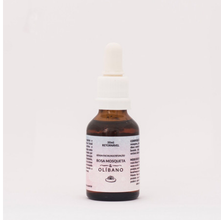
Figura 9: Sérum facial Rosa mosqueta e olíbano Naiá Biocosméticos

Fonte: http://www.naiabiocosméticos.com.br/serum-facial-ct-1ea2d2