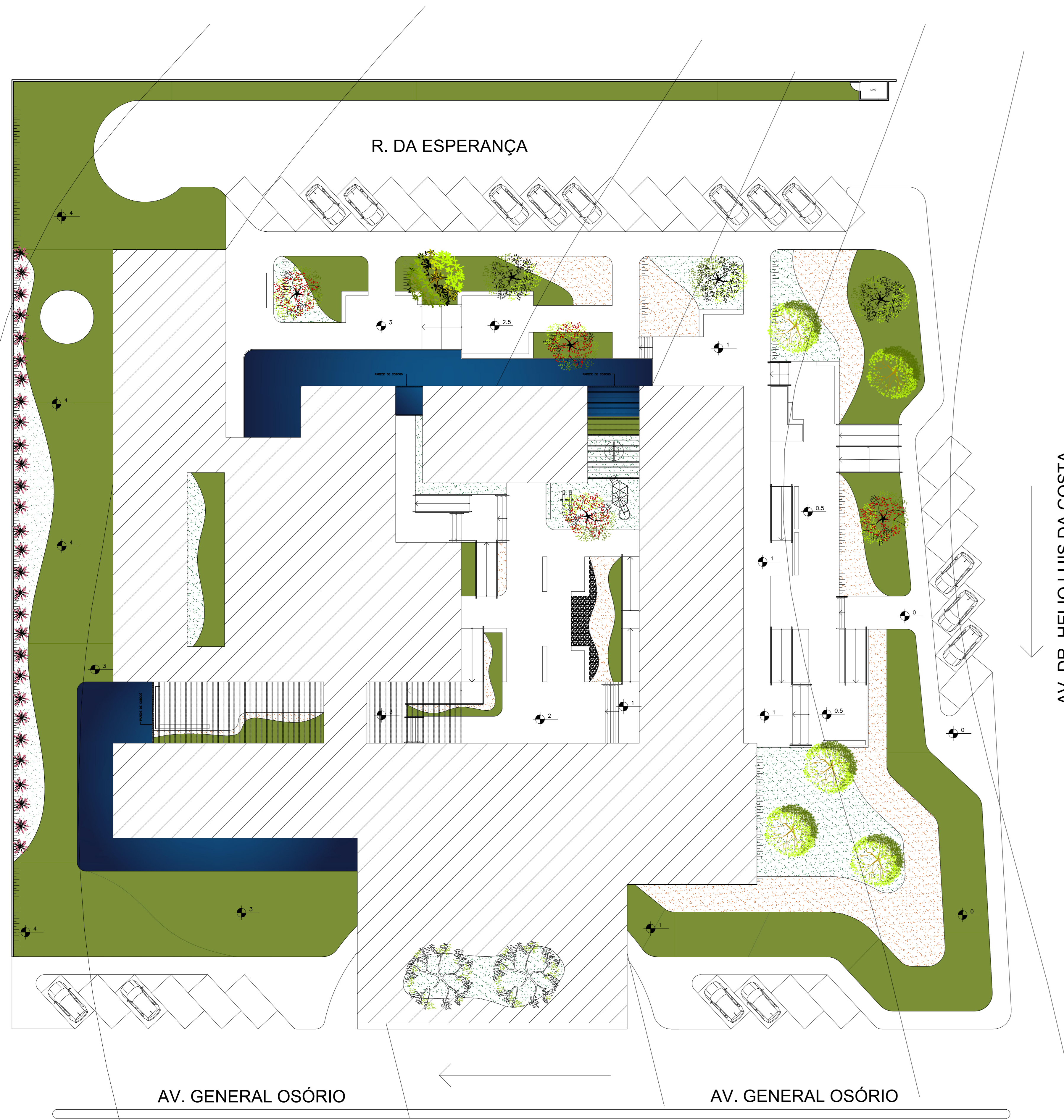
1 IMPLANTAÇÃO ESCALA 1:250