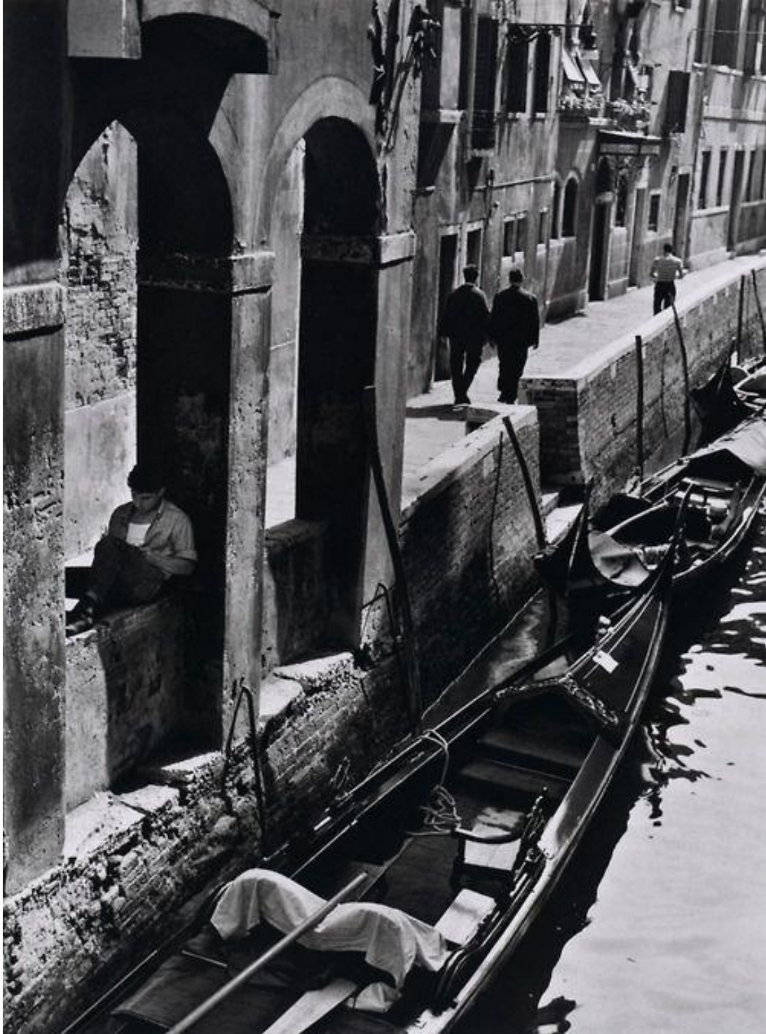
Figura 4 - André Kertész, Venice Young man reading on canal side , Venice, 1963.