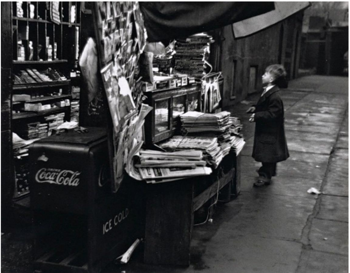
Figura 13 - André Kertész, Le kiosque à journaux , New York, novembre 1950.