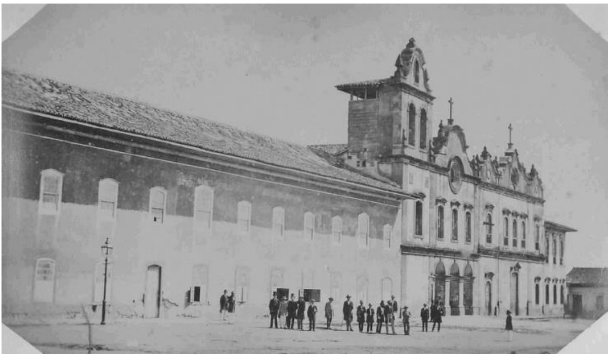
Figura 8 – Academia de Direito e Convento de São Francisco, SP, 1862.