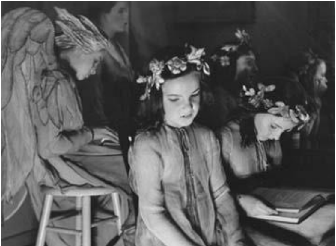
Figura 10 - André Kertész, Girls in fairy costumes , New York, 1938.