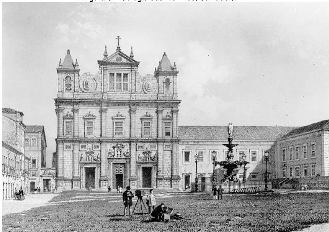
Figura 6 – Colégio dos Meninos, Salvador, BA.