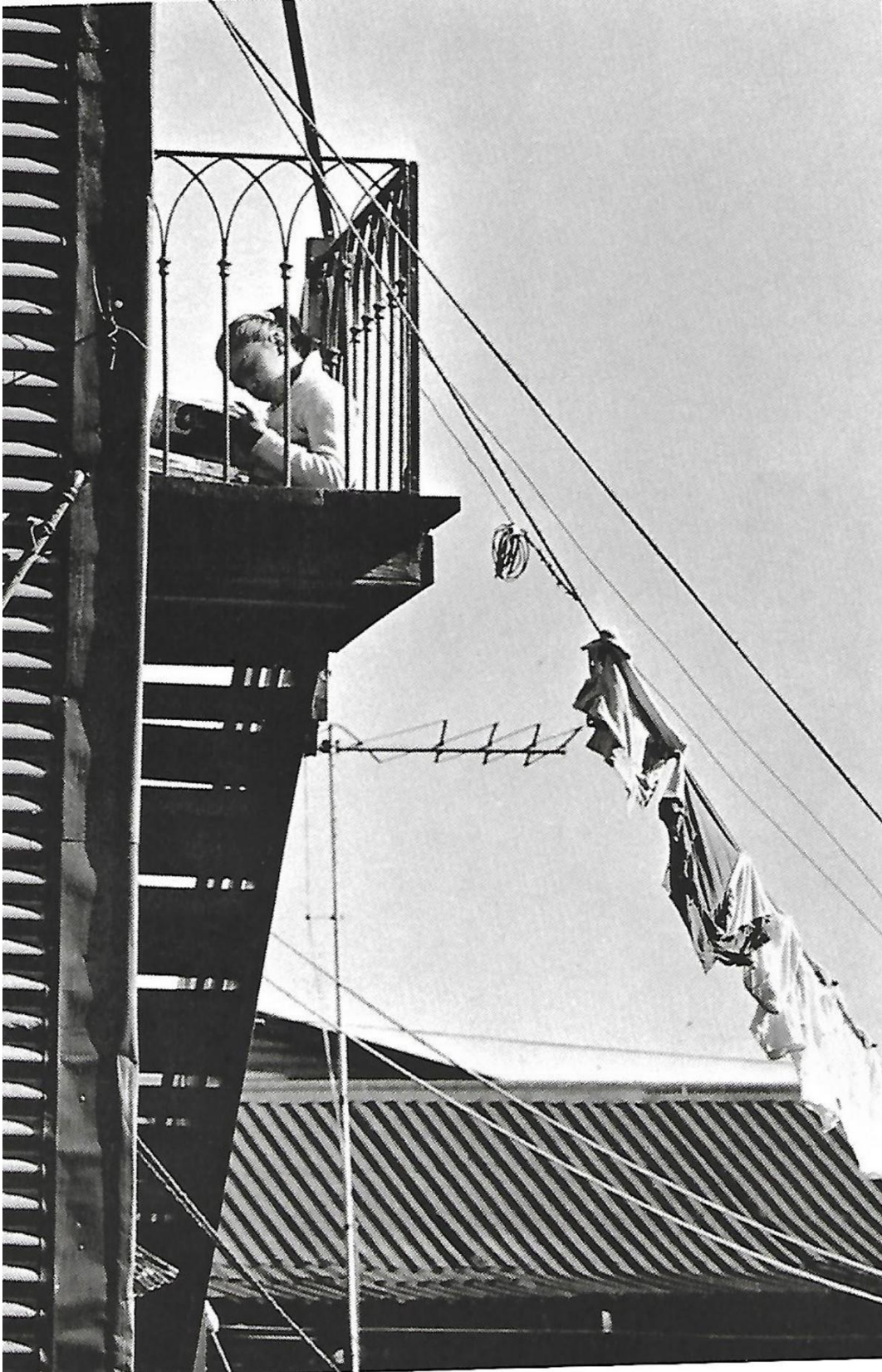
Figura 12 - André Kertész, En el balcón. La Boca, Buenos Aires, Argentina, 1962