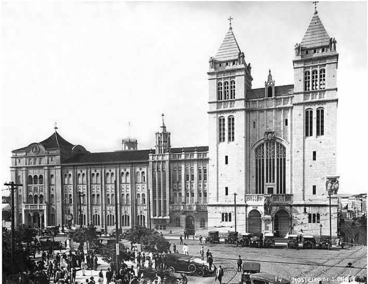
Figura 7 – Mosteiro de São Bento, São Paulo (1920).