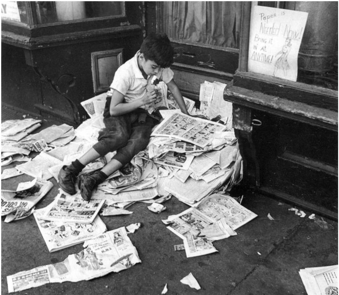
Figura 3 - André Kertész, Boy eating icecream on pile of newspapers, New York, 1944.