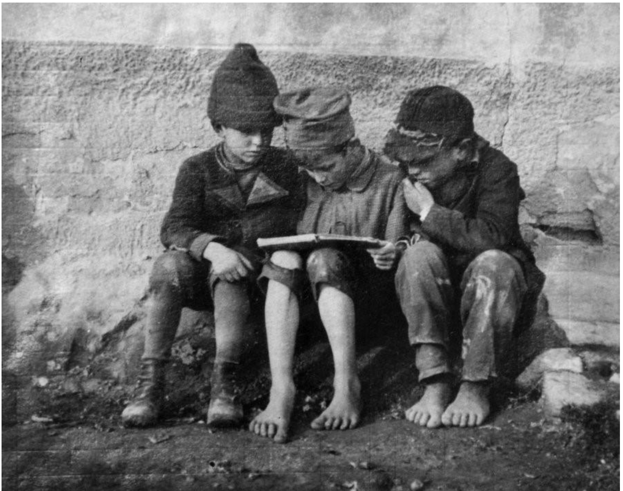
Figura 1 - André Kertész, Esztergom, Hungary (three boys reading) , 1915.