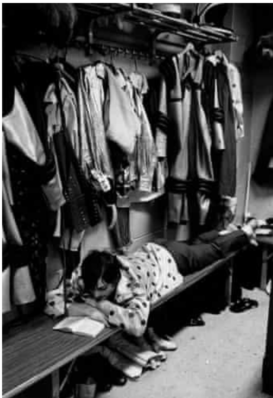
Figura 11 - André Kertész, Artista de circo no camarim , 1969.