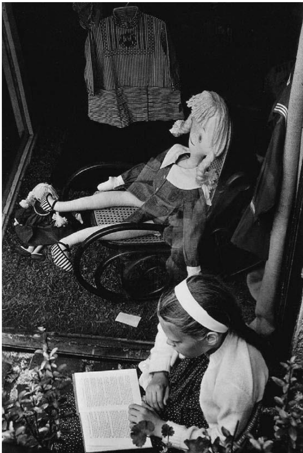
Figura 2 - André Kertész, New York , 23 septembre 1962.